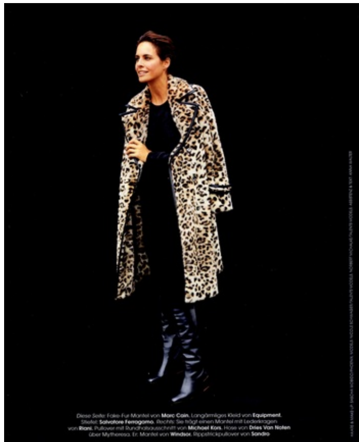
Diese Seite: Felle-Fur-Mantel von Marc Cain, Langärmeliges Kleid von Equipment, Schuhe: Salvatore Ferragamo, Rechte: Sie trägt einen Mantel mit Lederkragen von Riccì, Pullover mit Burchknausverschluss von Michael Kors, Hose von Diesel Van Notten über Mytheresa, Et. Mantel von Windale, Ripstickpullover von Sandio